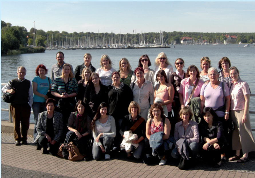
Team Braunschweig: Das Team der Augenklinik Dr. Hoffmann in Braunschweig vereint fachliche und menschliche Kompetenz zum Vorteil des Patienten.