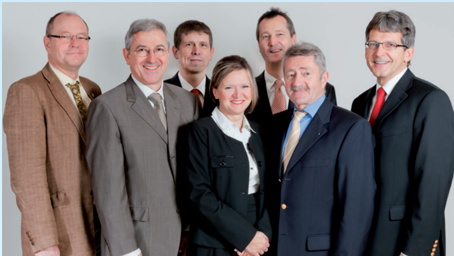
Miteinander für Ihre Augengesundheit. Das Ärzteteam des OcuNET Zentrums Niederbayern.

Seit 30 Jahren setzt die Landshuter Augenheilkunde in Niederbayern Maßstäbe und passt sich räumlich wie auch personell ständig an den wachsenden Bedarf der Patienten an.